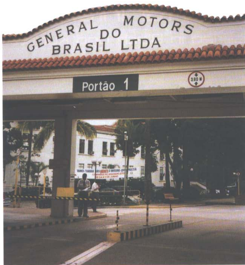
GM do Brasil vor den Toren von São Paulo: Dieses Werk baute General Motors bereits vor Jahrzehnten. Gespräche zwischen den Ausstellern des deutschen Gemeinschaftsstandes auf der Automec 2001 und Einkäufern von GM hatte das Forum Brasilien ebenso organisiert wie mit VW und DC.